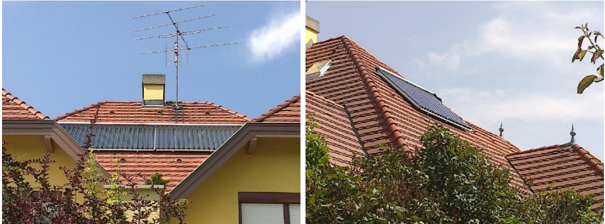
2-3. sz. kép: A nettó 13 m 2 napkollektor felület a tetőn elhelyezve

A melegvíz ellátást valamint a fűtést a napkollektor rendszer és a vízteres kandalló látja el, amelyek a rétegfeltöltős puffer tárolókat fűtik / 2-3. sz. kép. A puffer tárolók energiáját a processzorvezérelt frissvízmodulon keresztül a HMV előállítására is használják /4-5. sz. kép/. Biztonsági tartalékként a régi fűtési rendszerből 1 db gázkazán a napkollektoros összetett fűtési rendszerbe lett integrálva.