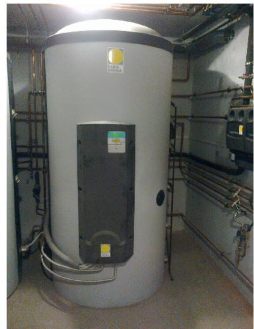
4. sz. kép: A vízteres kandalló és az Espresso kombi tároló a processzorvezérelt frissvízmodullal