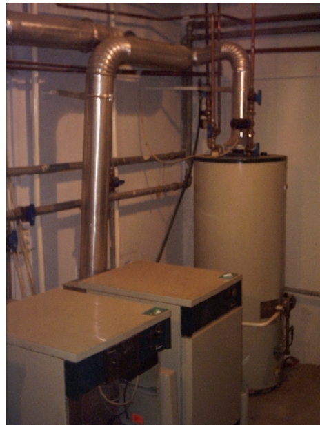
1. sz. kép: A régi fűtési rendszer

Az előzetes egyeztetések alapján megtervezésre került a napkollektoros összetett fűtési rendszer, amely tartalmazta a napkollektorokat /nettó 13 m 2 /, az Espresso 1100 literes processzorvezérelt frissvízmodullal ellátott rétegfeltöltős kombi tárolót, az 1000 literes rétegfeltöltős puffer tárolót, a 2 körös fűtési rendszert és a medencefűtés kevert fűtőköri állomásait, továbbá a 30 kW-os vízteres kandallót. A fűtési rendszer összehangolásáról a SystsComfort fűtésvezérlés gondoskodik, amely a SystsSolar Aqua, a SystsComfort WOOD, a SystsComfort POOL vezérlés kiegészítések működését összehangolja, valamint gondoskodik a teljes rendszer felügyeletéről.