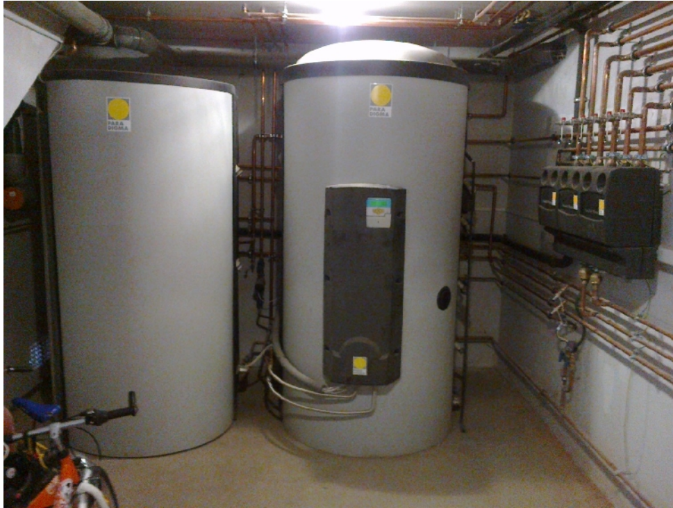
5. sz. kép: Puffer tároló kaszkád

A fűtési rendszer kevert fűtőköri állomáson /HSM/ keresztül gondoskodik az épület fűtéséről / 6. sz. kép/.